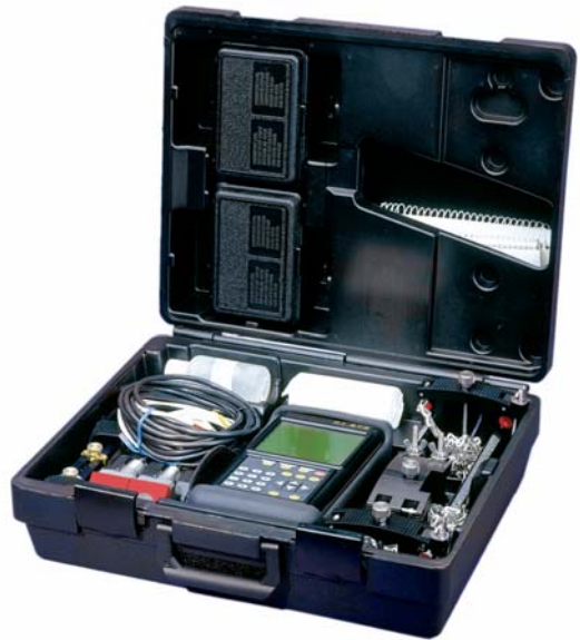
PT878便携式气体流量计系统及便携箱

即使是第一次使用，也可以在几分钟之内就完成测量——PT878流量计就是这么使用方便。只需输入现场参数、把传感器夹装在管外并调好声程。无需其它辅助工具，也无需管线上开孔。使用熟练的人可在一天内进行数十次完全不同的测试。PT878流量计是流量检测的理想选择。