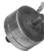
Model 11 Tension/Compression