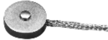
Model 13 Compression Only